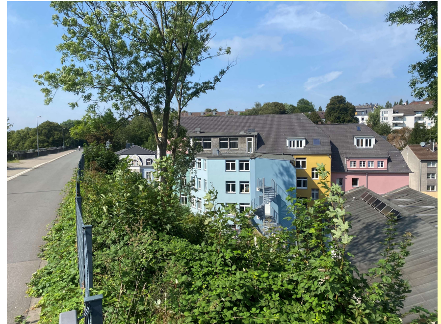
Rückseite zur Nordbahntrasse