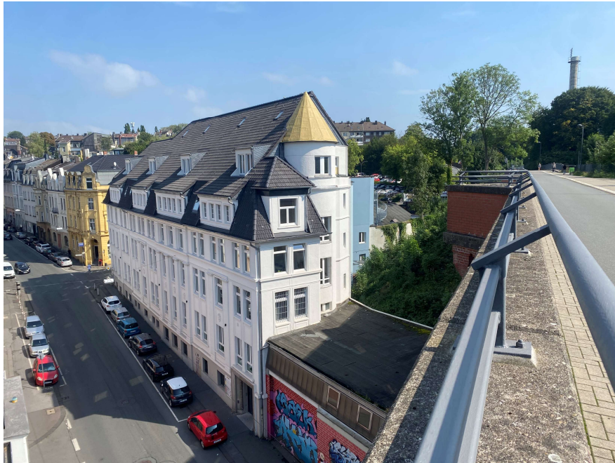
Vorderseite zur Wichlinghauser Straße