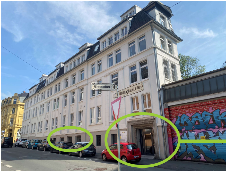
Haupteingang an der Wichlinghauser Straße und die 3 Fenster des neuen Raums